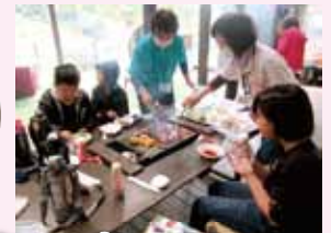
森のバーベキュー