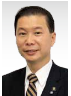
垂水市長 尾脇 雅弥

結びに、皆様方のご健康とご多幸をご祈念申し上げます、新年のご挨拶とさせていただきます。