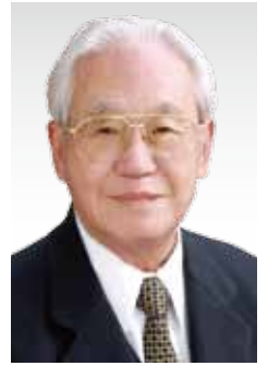
公益社団法人 垂水市シルバー人材センター