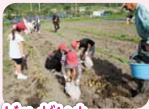
じゃがいも トウモロコシ収穫