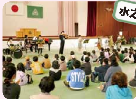
スプリング コンサート