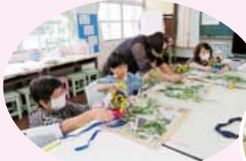
フラワーアレンジメント