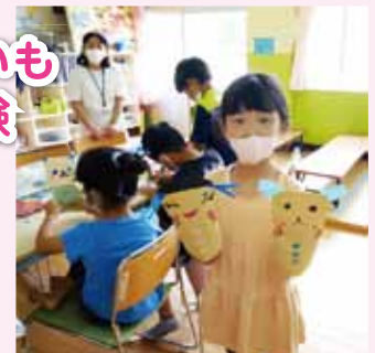
封筒パペット人形