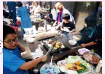
森の駅バーベキュー