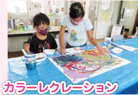
カラーレクレーション