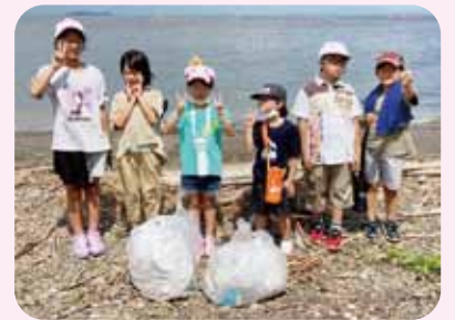
海岸清掃 ボランティア