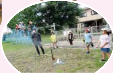
ペットボトルロケット製作